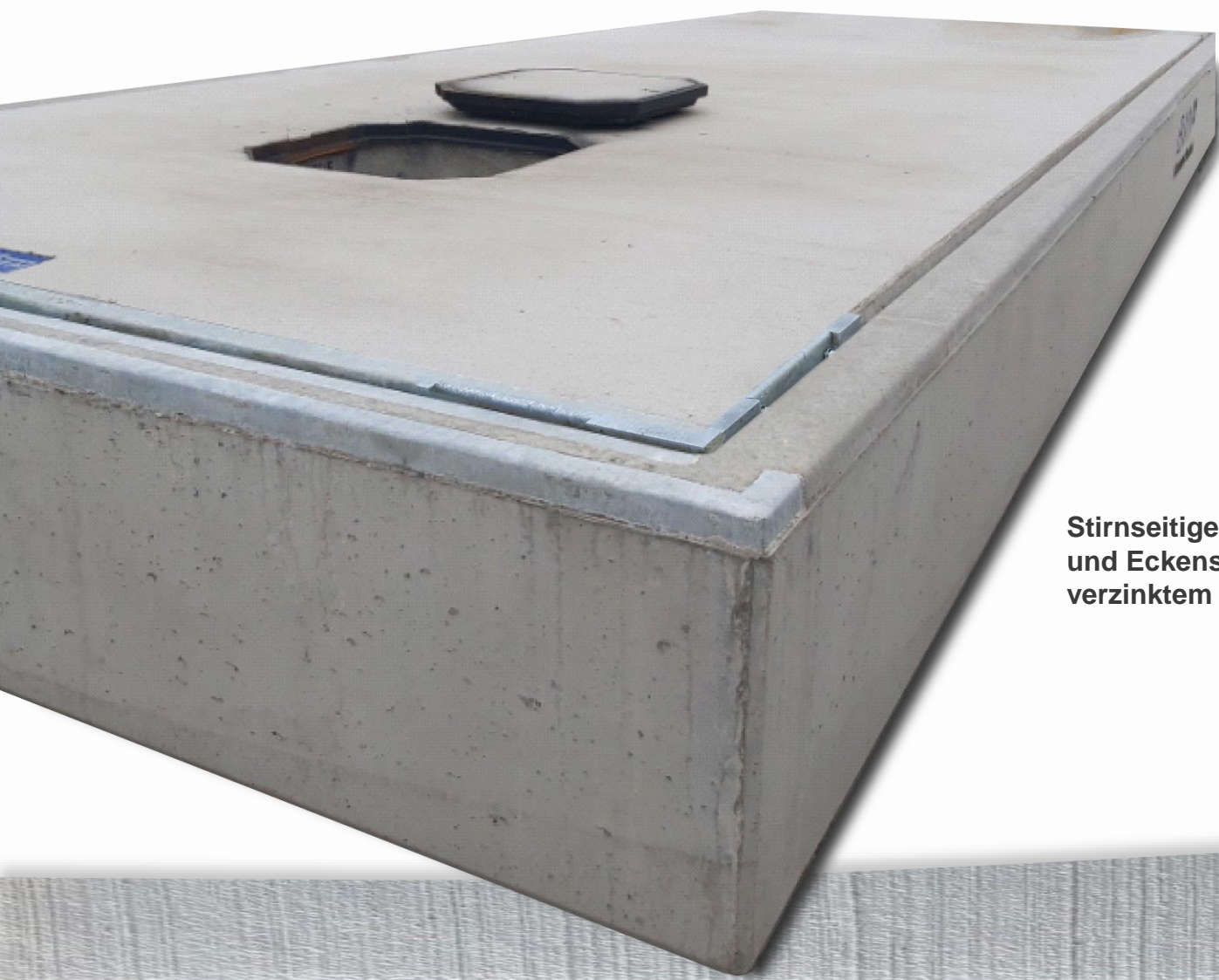
Stirnseitiger Kanten- und Eckenschutz aus verzinktem Stahl