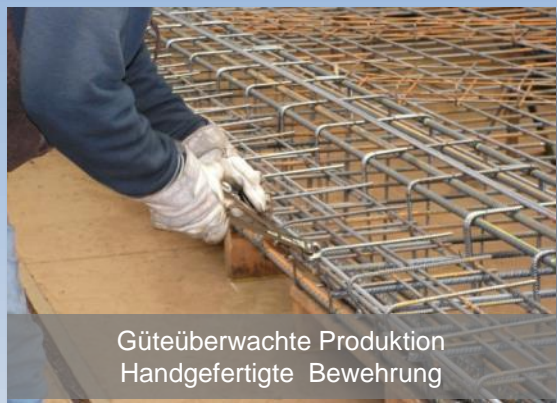
Güteüberwachte Produktion Handgefertigte Bewehrung

Mit unseren Digital-Wägeterminals und ausgereifter SOFTWARE wird «DIE INNOVATIVE 2.0» zu einer LEISTUNGSFÄHIGEN WÄGEANLAGE (siehe Produktinformationen Wägeterminals FlyNet-Baureihe und Wägedatensoftware Winweigh Light oder Plus).